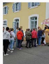
La gare de l'utopie